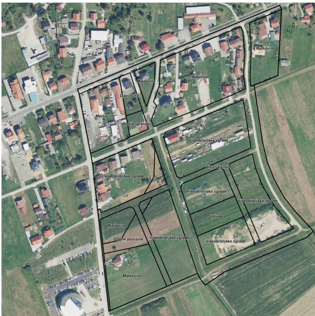
Kartografski prikaz 1.3. Provedba prostornog plana